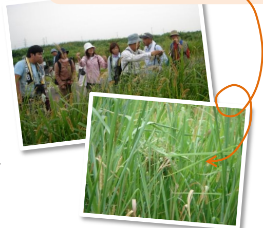
カヤネズミ調査の様子とカヤネズミの巣

ウェブサイトをご覧いただけない方は、郵送でお送りしますのでご希望の方は宛先を明記の上、A4サイズの書類が入る返信用封筒に200円分の切手を貼って下記まで請求してください。