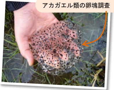
アカガエル類の卵塊調査