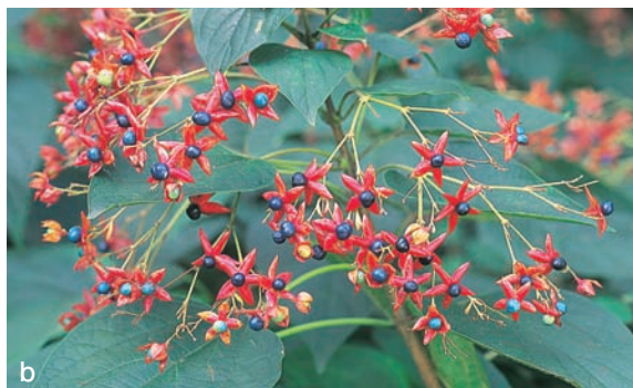
クサギの葉は、嫌なにおいのする植物と言われるが、ピーナツバターのにおいに似ていると言う人もいます。

めを感じたにおいが分からなくなることもあります。自然観察会では、いわゆる「香りの植物」だけのにおいに注目するのではなく、田んぼのにおい、草原のにおい、天気の変化のにおい……いつでも、何を観察するときも、あらゆる感覚を総動員して自然を感じることが大切です。視覚に障害のある人たちや子どもの場合も同じですが、嗅覚が鋭いがゆえに、ハーブのにおい、特にローズマリーのような強いにおいを嫌う人も多いので注意が必要です。また、一般に年齢を重ねると嗅覚は衰えるものです。嗅覚の個人差も大きいので、においが分からない人もいることを理解しておきましょう。