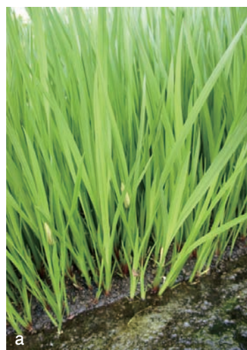
シヨウブ（サトイモ科）

5月5日の端午の節句に菖蒲湯に入る風習があります。シヨウブは「尚武」に通じるとして、男子の武運を願って始まった風習であるという説があります。お風呂に浮かべたシヨウブの葉を、子どもが頭に結んで遊ぶのは子どもの日のほほ笑ましい光景です。シヨウブの根には、アザロンやオイゲノールという精油成分が含まれています。風呂に入れるときには、葉の根元から発する香りを楽しむために、根元から刈り取った長いままの葉を浮かべます。なお、6月中旬に美しい花を咲かせるハナシヨウブはアヤメ属の植物で、シヨウブ（シヨウブ属）とは別の仲間です。ハナシヨウブには、シヨウブのようなさわやかな香りはありません。においを具体的な言葉で表現することは難しいことです。においを表す言葉は極端に少なく、「悪臭、刺