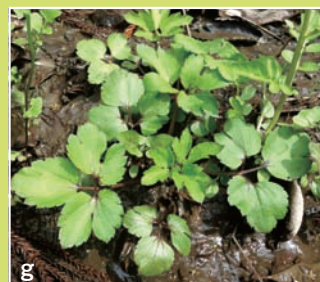
ケキツネノボタン(キンボウゲ科)有毒。草のにおい。