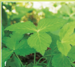
ミツバ(セリ科) 食べられる。独特の香り。

サンショウとイヌザンショウは小葉の付き方も違いますが、においははっきり違います。どちらもミカン科で特徴的なにおいがしますが、サンショウの方が良いにおいとされ、イヌザンショウはどちらかというとナツミカンの葉のにおいに近いです。