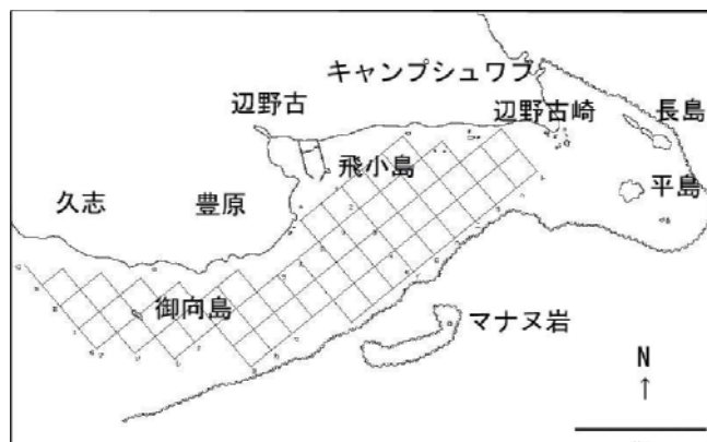
図2. 辺野古における調査位置(200 m間隔のグリッドを設定した)

5~10個の50×50 cmのコドラートをランダムに設置し、時刻、水深、底質、海草全体の被度、海草の種ごとの被度、備考(ジュゴンの食痕や赤土による影響)を記録したこと、調査終了後キャリブレーションを実施したことは嘉陽と同様です。