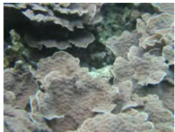
1区埋立地に生息していたリュウキュウキッカサンゴ（今、浚渫土砂で生埋め）