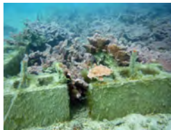
移植先のリュウキュウキッカサンゴ（今は、泥をかぶって劣化している）