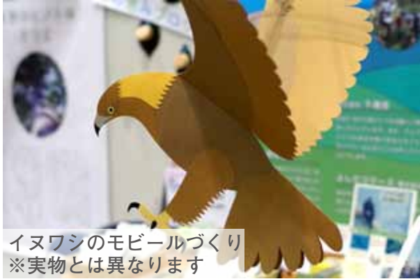
イヌワシのモバイルづくり ※実物とは異なります