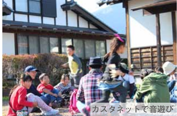
カスタネットで音遊び

カスタネットをつかって自然の音で遊んだり、 イヌワシのモバイルづくりや 森のクイズでみんなと一緒に楽しめます！